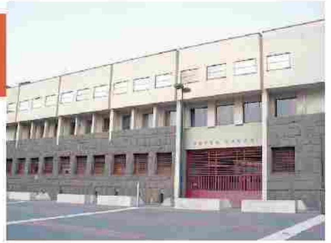
● Lex Borsa Valori su piazzale Valdo Fusi è la sede principale della rassegna

L' appuntamento è ormai consolidato: da cinque anni a questa parte, a cavallo tra la fine della primavera e l'inizio dell'estate, Torino ospita il festival «Architettura in Città». L'edizione 2015, in programma dal