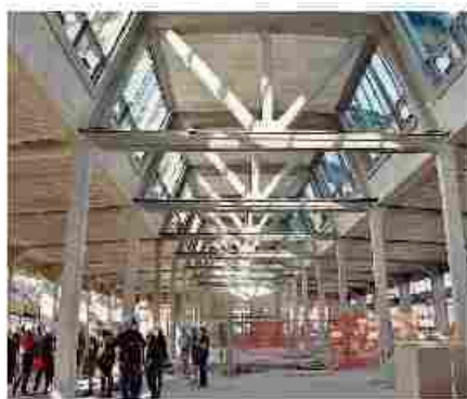
● L'1 luglio visita all'Incet di via Banfo

ardo Bergamin. Sabato 4 luglio , alle 10,30, si terrà «The Art Pacemaker», una corsa podistica promossa da Cittadellarte - Fondazione Pistoletto, che vedrà l'artista Franco Airaud guidare i partecipanti alla riscoperta di architetture e scorci nascosti del centro cittadino. Gli appassionati di foto-