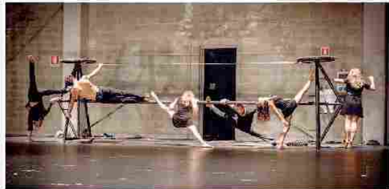
● Mercoledì 30 alla Borsa Valori spettacolo di danza, circo e teatro «VertigoSuite#2». Qui a destra la foto di un'opera della personale di Piero Mollica alla galleria Riccardo Costantini Contemporary

39 sedi a Torino e 7 comuni della provincia, tra cui Ivrea, Chieri e Venaria. Come nelle scorse edizioni non mancheranno i percorsi guidati, le mostre e gli spettacoli collaterali. Il programma completo sul sito www.architetturaincitta.it